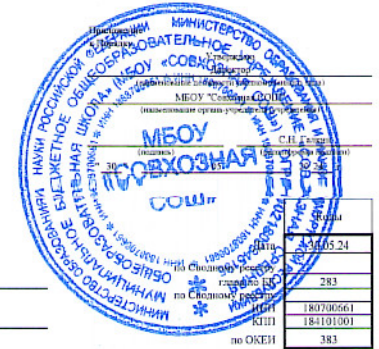
Раздел 1. Поступления и выплаты